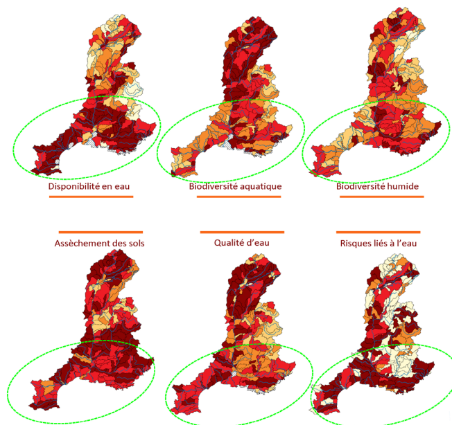
Figure 2. Vulnérabilité vis-à-vis des différents enjeux liés au changement climatique pour les 193 sous-bassins du SDAGE Rhône-Méditerranée

Cette action à l'échelle large du bassin s'articule bien sûr avec les stratégies d'adaptation que bâtissent, à différents échelons territoriaux, les acteurs de la gestion locale de l'eau et de la biodiversité - des collectivités aux syndicats de rivière ou aux gestionnaires d'espaces naturels protégés. Pour ces derniers, en première ligne du changement climatique dont ils observent les effets au quotidien, la mise à disposition d'outils et de méthodes permettant de repenser leurs pratiques et de co-construire l'adaptation locale, constituait une attente forte. Elle a trouvé des éléments de réponse notamment à la faveur du Life Natur'Adapt, programme partenarial piloté par Réserves naturelles de France qui a mobilisé plusieurs partenaires et un réseau de 21 aires protégées cinq années durant (2018-2023), avec le double objectif d'apporter aux gestionnaires d'aires protégées un socle méthodologique commun pour mener une démarche d'adaptation de la gestion au changement climatique et de développer une communauté autour de cet enjeu, regroupée sur une plateforme collaborative (plateforme Natur'Adapt). Noémie Nojaroff (Ingénieure à la Tour du Valat), qui a piloté par le passé la mise en œuvre de cette démarche d'adaptation pour la réserve naturelle du Bagnas (une lagune côtière héraultaise), en a rappelé les grandes étapes. L'étude du climat passé et futur, et ses