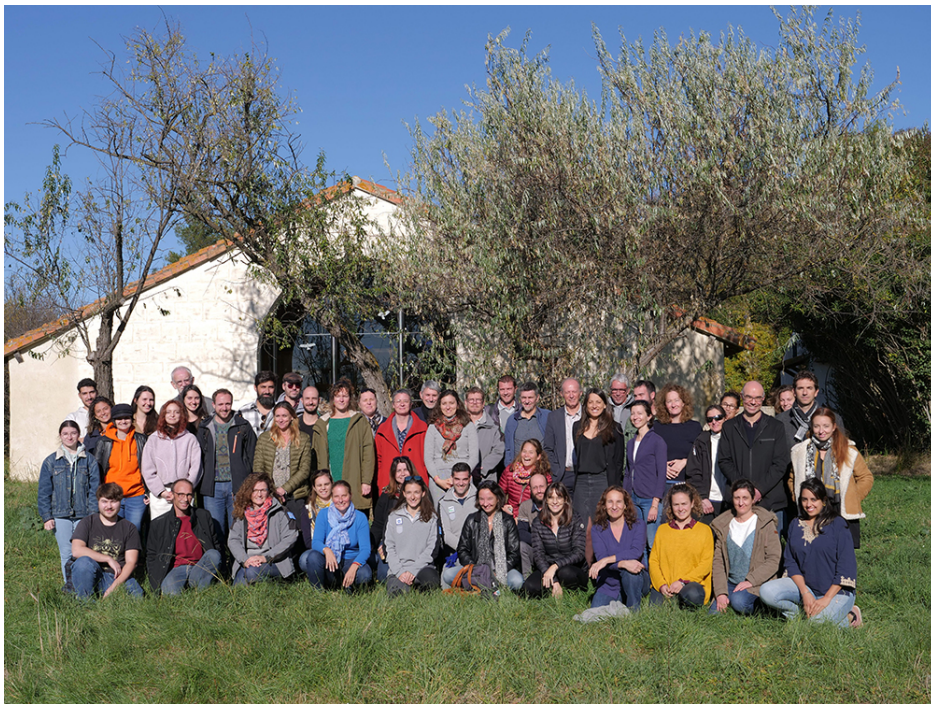
8 ème plateforme RG : 137 personnes, appartenant à 56 structures des trois régions méditerranéennes, y ont participé dont 59 personnes en présentiel à la Tour du Valat (Arles)

Cette évolution annoncée dans la sphère de la gestion n'est pourtant qu'une composante de la transformation profonde que le changement climatique appelle dans le regard de nos sociétés sur les milieux humides littoraux : cette transformation impliquera l'ensemble des acteurs territoriaux ; elle devra pouvoir s'appuyer sur une gouvernance locale réinventée et – peut-être – moins complexe. Finalement, la menace climatique pourrait bien être aussi l'occasion de reconsidérer collectivement la place des milieux humides littoraux dans les projets de territoire !